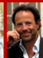
Marc Levy © Alaster Muler