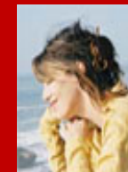
Jane Birkin