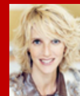
Sandrine Kiberlain