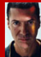
Etienne Daho